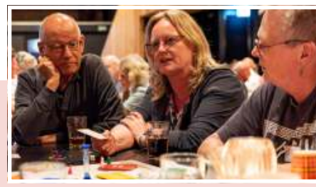
Senioren Zelf aan Zet